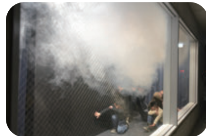
煙・暗闇避難体験